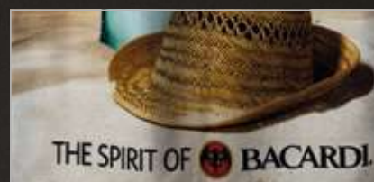
Digitaldruck Digital Print